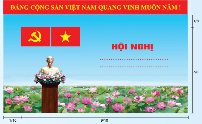
Hình 3a (cờ không tạo sóng)