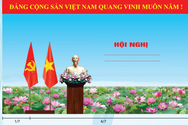
Hình 2 (Cờ có cán)