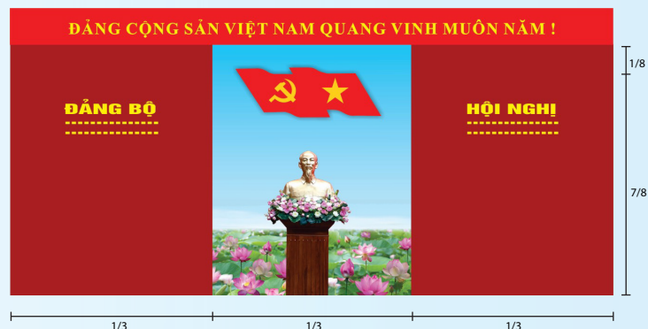
Hình 4a (kích thước hội trường rộng)